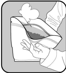
(1)空気をざっくり抜きます。