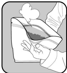
(1)空気をざっくり抜きます。