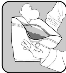
(1)空気をざっくり抜きます。