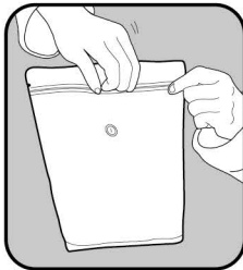
(2)ジップをしっかり閉めます。